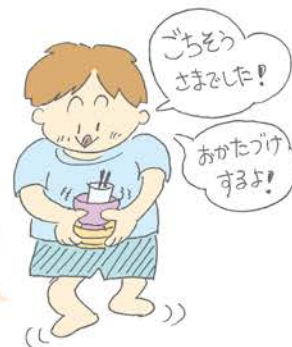
イラスト: 中野安芸子(篠崎保育園)