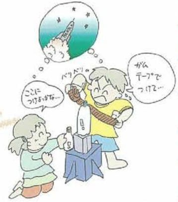
イラスト: 中野安芸子 (篠崎保育園)