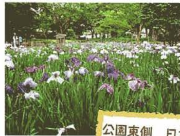
公園東側 日本庭園